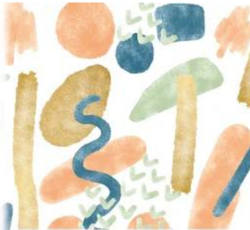
Zkoušeblatění Oblastní galerie Liberec je liberecký kraj Partneři: Česká rozhláska Liberec | rfm | Art Labours | Artisk | ZUMA | Hask Art | Kufra | RENOS | Hlábek